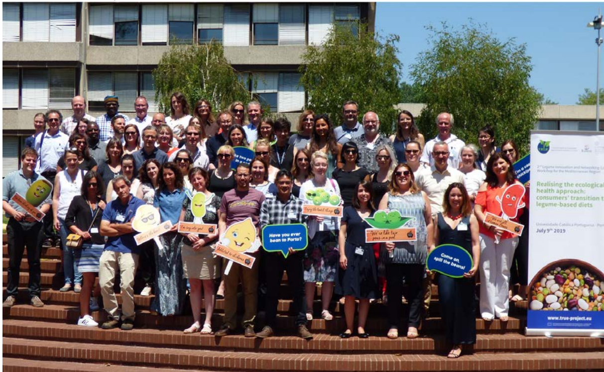
Η ομάδα του TRUE στο συνέδριο 2 nd Mediterranean Legume Innovation and Networking (LIN) Workshop και στη Γενική Συνέλευση στο Πόρτο, τον Ιούλιο 2019.

Με τις θερμότερες ευχές, Henrik Maaß και ομάδα επικοινωνίας του TRUE.